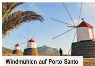
Windmühlen auf Porto Santo