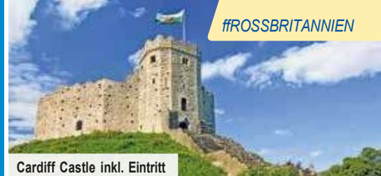
Cardiff Castle inkl. Eintritt

Alle verfügbaren Reisettermine & Flughäfen finden Sie auf trendtours.de