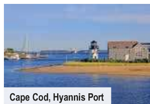
Cape Cod, Hyannis Port

Beantragung der Einreiseerlaubnis ESTA über trendtours € 89 p. P.