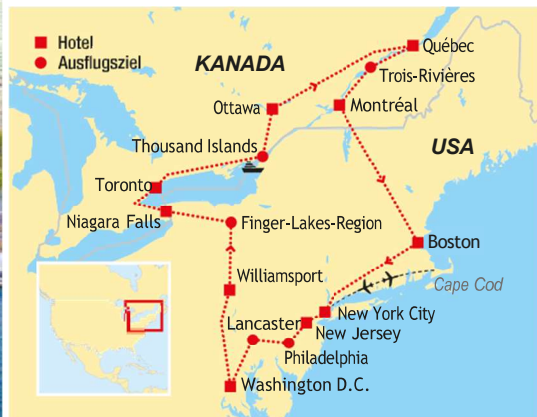
Bootsfahrt durch den Nationalpark Thousand Islands