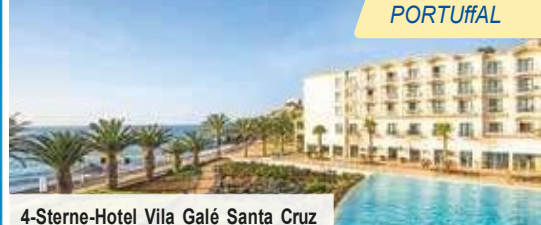
4-Sterne-Hotel Vila Galé Santa Cruz