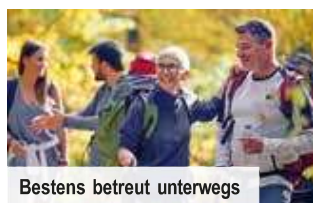
Bestens betreut unterwegs