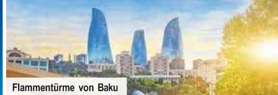
Flammentürme von Baku