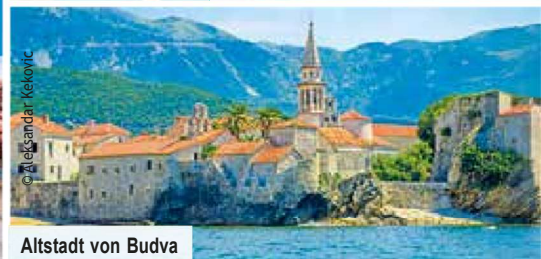
Altstadt von Budva