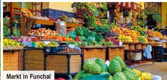
Markt in Funchal