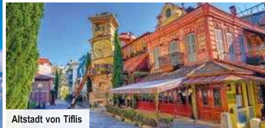
Altstadt von Tiflis