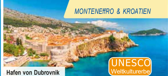
Hafen von Dubrovnik