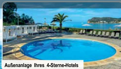
Außenanlage Ihres 4-Sterne-Hotels

11-tägige Erholungsreise mit 12 Premium-Kuranwendungen inklusive Flug