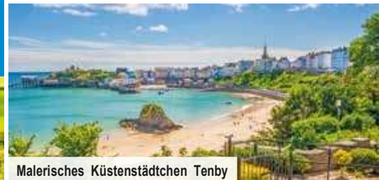
Malerisches Küstenstädtchen Tenby