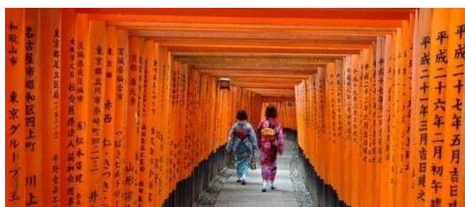
Immer ein Erlebnis: Besuch des Fushimi Inari-Schreines

Di 19.01.27 + Di 02.02.27 / 5. Erlebnis-Tag: Heute unternehmen wir einen Tagesausflug in die Nähe vom Mt. Fuji – dem heiligen Berg. Wir fahren nicht in den Hakone Nationalpark (wie bei unserem Reise-Programm „Höhepunkte von Japan), sondern nach Kawaguchi-ko und kommen somit viel näher an den Mt. Fuji heran. In den Wintermonaten ist die Wahrscheinlichkeit sehr groß, daß sich der 3777 m hohe Berg mit Schneehaube bei bester Sicht zeigt. Rückkehr nach Tokyo und Übernachtung in unserem Hotel in Ginza.