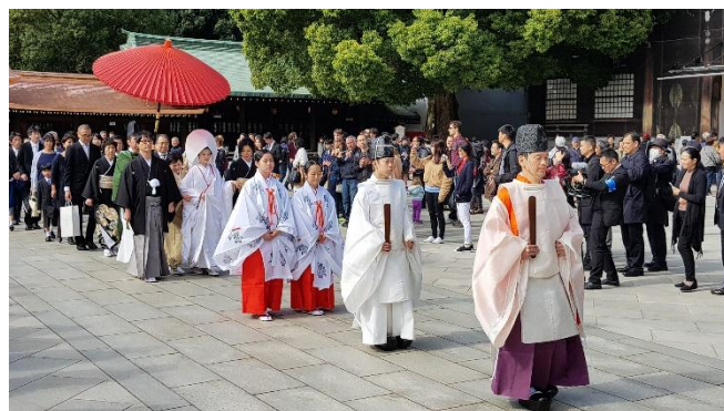
Hochzeit im Meiji Schrein

Sa 16.01.27 + Sa 30.01.27 / 2.Erlebnis-Tag Ankunft am Flughafen Narita oder Haneda. Fahrt nach Tokyo, Check-In im Hotel im Stadtteil Ginza und Übernachtung in Tokyo.