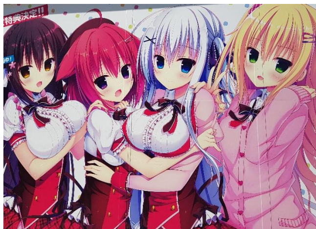
Herrlich verrückt: das Szene-Viertel Akihabara mit 1001 Foto-Motiven

Besuch eines japanischen Gartens im Luxushotel Besuch des berühmten Meiji-Schreins Besuch der Aussichtsplattform im Metropolitan Government Building in Shinjuku. Übernachtung im Hotel in Tokyo Ginza.