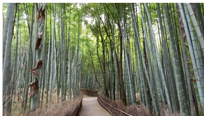
Bambuswald von Arashiyama

Altstadt von Kyoto: mit dem Kiyomizu-dera – Tempel Goldener Pavillon – das Schmuckstück im Norden von Kyoto das Stadtzentrum mit dem berühmten Nishiki-Markt, wo Sie allerlei japanische Spezialitäten probieren können Übernachtung in Kyoto.