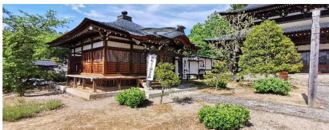
Takayama am Rande der japanischen Alpen

So 24.01.27 + So 06.02.27 / 11. Erlebnis-Tag Heute unternehmen wir einen Ausflug per Eisenbahn in das 60 Zug-Minuten entfernte Nara , Nara war von 710 bis 784 die erste permanente Hauptstadt Japans und ist daher noch älter als Kyoto. In Nara werden wir von hunderten zahmen, frei herumlaufenden Rehen überrascht. Überall gibt es Verkaufsstellen, die Futter für die Rehe liefern – die Rehe fressen uns das Futter aus der Hand. Unser Ziel ist jedoch der Todai-ji-Tempel , das größte Holzgebäude der Welt mit einer gigantischen Buddhasstatue aus Bronze. Im Hirschpark von Nara besuchen wir auch die wunderschöne Tempelanlage Kasuga-Taisha-Schrein.... 3000 Steinlaternen säumen den Zugang. Rückfahrt von Nara nach Kyoto. Übernachtung in Kyoto.