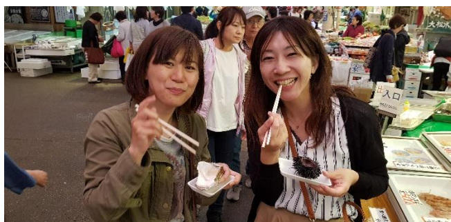
Austern und Seeigel ganz frisch ... im Ohmicho-Markt von Kanazawa

Mi 20.01.27 + Mi 03.02.27 / 6. Erlebnis-Tag: Heute unternehmen wir einen Ganztagesausflug nach Nikko . Gleich nach Kyoto steht die „Barockstadt“ Nikko auf unserer „Best of Japan“-Liste ganz weit oben. Die Tempelanlagen von Nikko gehören - völlig zu recht - zum Weltkulturerbe der UNESCO. Eingebettet in eine malerische Berglandschaft bieten die verschiedenen Tempel Fotomotive in Hülle und Fülle. Wir fahren mit dem Shinkansen von Tokyo nach Utsonomiya und dann weiter mit einem Regionalzug nach Nikko. In Nikko besuchen wir die Shinkyo-Brücke, den großartigen Toshuga-Schrein, und den Rinno-ji-Tempel (dessen jahrelange Renovierung jetzt abgeschlossen ist) oder als Alternative gleich gegenüber einen schönen japanischen Garten.