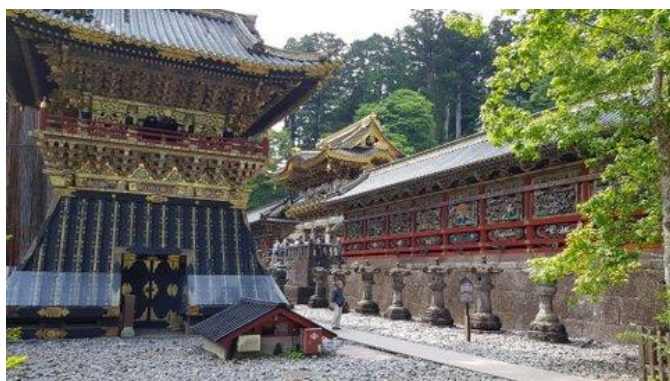
Unvergleichlich schön: die „Barockstadt“ Nikko

Do 21.01.27 + Do 04.02.27 / 7. Erlebnis-Tag: Tokyo-Kyoto Heute legen wir die 513 km lange Bahnstrecke von Tokyo nach Kyoto im Shinkansen ohne Umsteigen in 160 Minuten zurück; mit etwas Wetter-Glück haben wir unterwegs nochmals einen schönen Blick auf den Mt.Fuji. Nach Ankunft in Kyoto checken wir in unserem Hotel in Bahnhofsnähe ein. Am Nachmittag hat der stadtnahe Fushimi Inari-Schrein die besten Lichtverhältnisse zum Fotografieren. Der Schrein mit seiner kilometerlangen Tori-Galerie wurde durch den Film „Die Geisha“ weltberühmt.