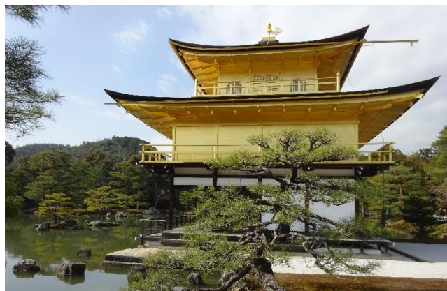
Wunderbar: der Goldene Pavillon in Kyoto