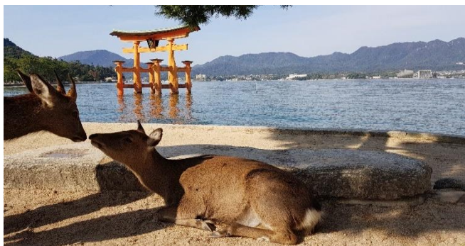
Insel Miyajima vor den Toren Hiroshimas

Sa 23.01.27 + Sa 06.02.27 / 9. Erlebnis-Tag: Fahrt mit dem Shinkansen von Kyoto nach Hiroshima . Hiroshima –die Partnerstadt von Hannover- ist ein „Muss“ für jeden Japan-Reisenden. Ein Besuch des „Memorial Peace Parks“ als Gedenkstätte zum ersten Atomwaffen-Einsatz gegen Zivilisten bleibt unvergesslich. Nach dem Besuch des „Peace Parks“ setzen wir mit einer modernen Fähre hinüber zur Insel Miyajima. Weltberühmt ist dort das hölzerne Torii aus dem Jahr 1875, das etwa 160 Meter vor dem Schrein steht. Bei Ebbe kann es zu Fuß erreicht werden, bei Flut steht es vollständig im Wasser. Es ist eines der meistfotografierten Wahrzeichen Japans. Der Schrein und das Torii wurden 1996 von der Unesco zum Weltkulturerbe erklärt. Wir werden zahme Rehe bewundern, die überall auf der Insel anzutreffen sind und keine Scheu vor Menschen haben. Rückfahrt mit dem Shinkansen nach Kyoto und Übernachtung im Hotel in Kyoto.