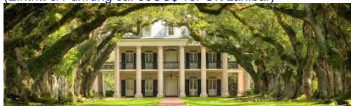
Einmalig schön: Houmas House Plantation & Gardens

Sie verlassen Baton Rouge in südlicher Richtung und nähern sich dem berühmten Mississippi, der längste Fluss Nordamerikas. Hier, im Bereich des Mississippi Delta liegen gigantische Sumpfgebiete, die sogenannten „Bayous“, mit einzigartiger Flora und Fauna. In dieser Region liegen die prächtigen Herrenhäuser, die besichtigt werden können. Unser Favorit: „Houmas House Plantation & Gardens“– hier machen wir eine Pause zur fakultativen Besichtigung (Eintritt & Führung ca. 30US$ vor Ort zahlbar)